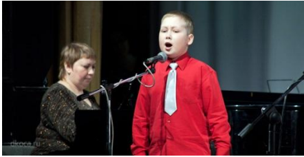
2. Детский хор